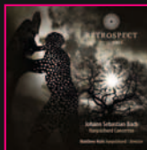
Retrospect Ensemble J.S. Bach Harpsichord Concertos