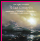
Scottish Chamber Orchestra Weber Wind Concertos

For even more great music visit linnrecords.com