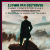
Artur Pizarro & Scottish Chamber Orchestra Beethoven Piano Concertos 3, 4 & 5