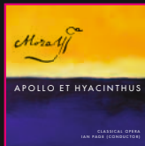
Classical Opera Mozart Apollo et Hyacinthus