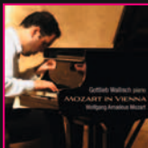
Gottlieb Wallisch Mozart Mozart in Vienna