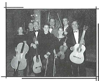
Logumkloster Chamber Orchestra Камерен ансамбъл "Льогумклоостър"