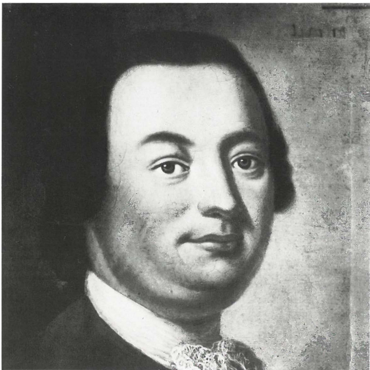
Johann Christoph Friedrich Bach