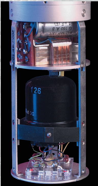
Microphone Neumann U47, opened, with VF 14 valve Mikrofon Neumann U47, geöffnet, mit einer Röhre VF 14 Le microphone Neumann U47, ouvert, avec une lampe VF 14

Over the last half century the transistor has transformed our world. Nowadays no computer or household appliance functions without one. And for audio technology we wondered whether anything got lost in the process. Was the world really better in the days when audio signals could only be amplified through tubes? This question inspired the somewhat crazy idea of the transistor-free audio disc, "Tube Only". Our first Tube Only recording was TACET no. 74, which received an outstanding welcome. The second Tube Only recording, the award-winning recording of Franz Schubert's String Quintet (recording no. 110) is now being followed by the third TACET production which completely dispenses with the influence of semi-conductors. If you want to know more details about the equipment used, you should purchase recording no. 74. In the booklet we explain in detail the transmission chain (the path of the electric signals). Here are some more photos.