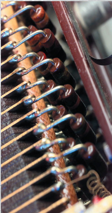
W 85 fader, detail photo of the resistors Regler W 85, Detailaufnahme der Widerstände Potentiomètre W 85, à résistances fixes

Seit einem halben Jahrhundert verändert der Transistor unsere Welt. Kein Computer, kein Haushaltsgerät ist ohne ihn mehr denkbar. In Bezug auf die Audiotechnik wollten wir gerne wissen: Ging dabei etwas verloren? War die Welt vorher wirklich besser, als Audiosignale nur durch Röhren verstärkt werden konnten? – Aus dieser Frage entstand die zunächst etwas verrückte Idee von der transistorlosen Schallplatte »Tube only«. Erstmals realisiert wurde sie auf unserer Aufnahme Nr. 74. Sie fand riesengroße Resonanz. Nach der daraufhin erschienenen zweiten »Tube only«-Aufnahme, der preisgekrönten Einspielung des Streichquintettes von Franz Schubert (Aufnahme Nr. 110) ist dies bereits die dritte TACET-Produktion, die vollständig auf den klanglichen Einfluss von Halbleitern verzichtet. Wer Genaueres über die verwendeten Geräte usw. erfahren möchte, sollte sich noch Nr. 74 zulegen. Dort wird die Übertragungskette (elektrischer Signalweg) genau erläutert. Hier einige weitere Fotos.