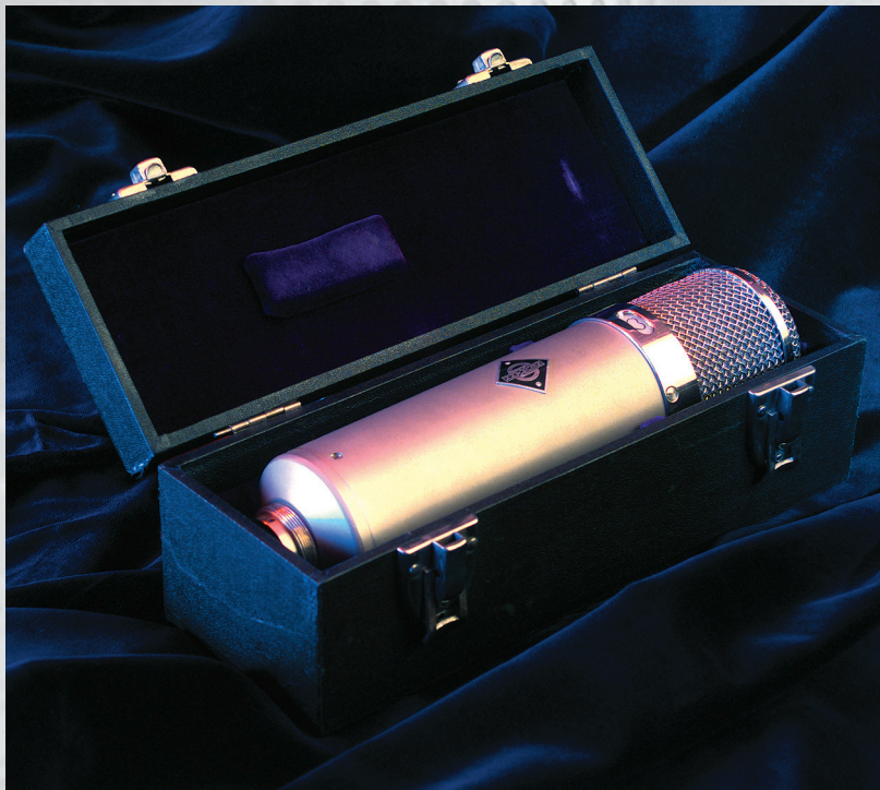
Microphone Neumann U47 Mikrofon Neumann U47 Le microphone Neumann U47