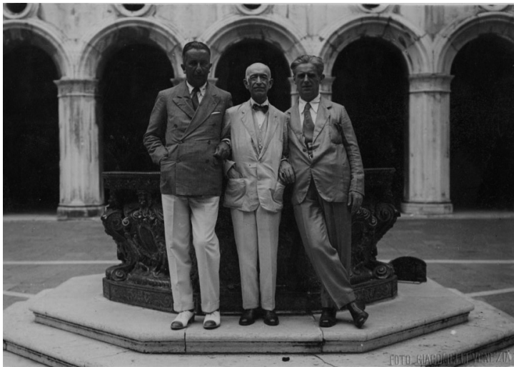
Alfredo Casella, Manuel de Falla and Gian Francesco Malipiero at Palazzo Ducale, Venice, 1932.