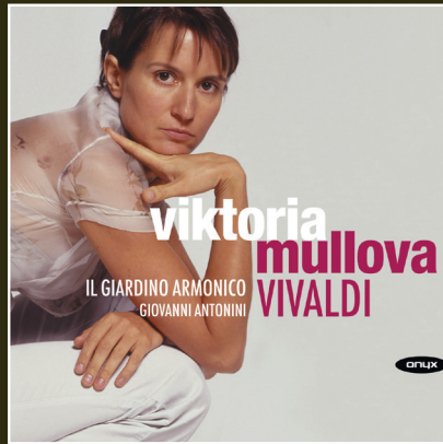
ONYX 4001 Viktoria Mullova Vivaldi: Violin Concertos