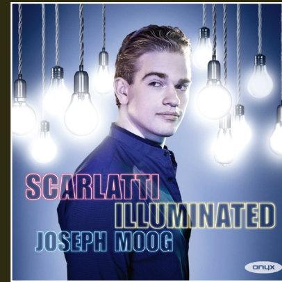
ONYX 4106 Joseph Moog Scarlatti Illuminated