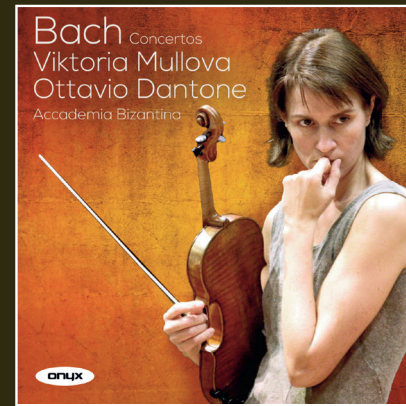
ONYX 4114 Viktoria Mullova J.S. Bach: Violin Concertos