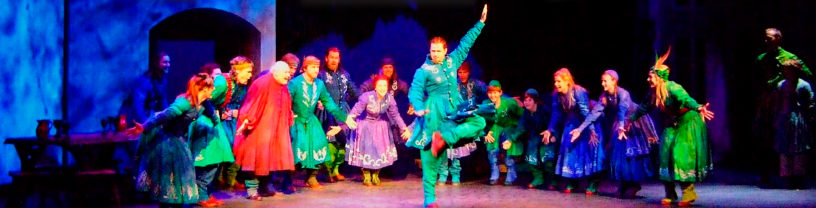
Bilder från GöteborgsOperans uppsättning