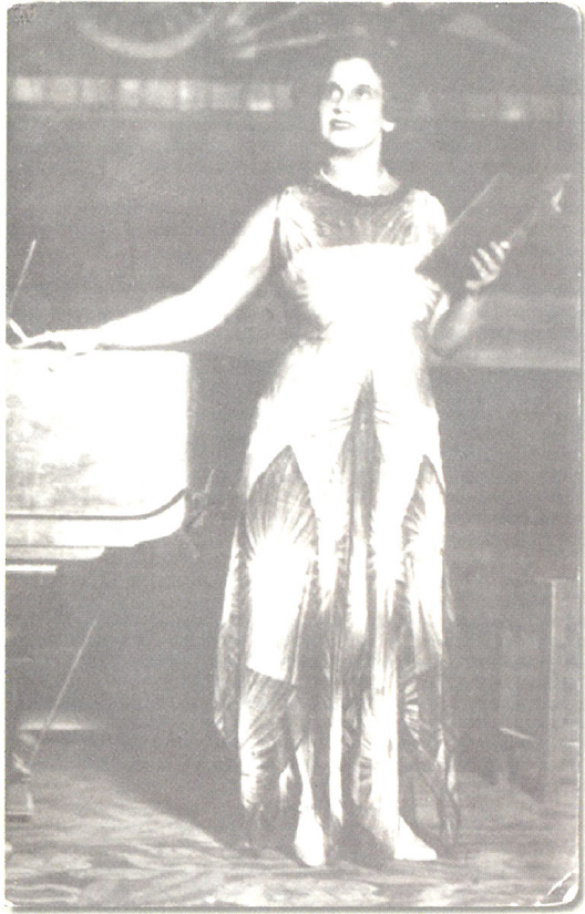
Валерия Барсова в свой приезд в Самару из заграничной гастрольной поездки (осень, 1929 г.) Valeria Barsova on return from the European tour (Samara. Autumn, 1929)