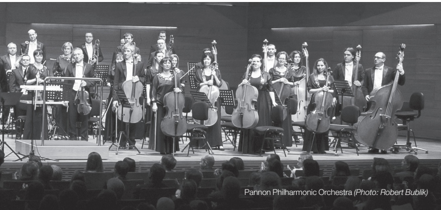
Pannon Philharmonic Orchestra