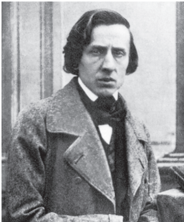
Frédéric Chopin, 1849