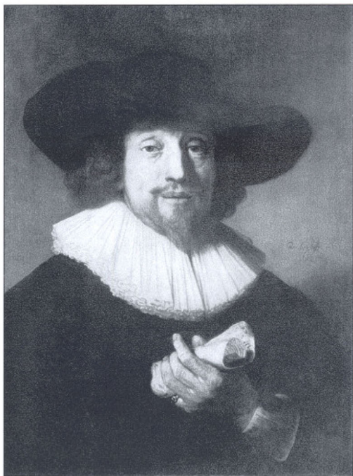
Rembrandt van Rijn, Bildnis eines Musikers, sehr wahrscheinlich des 48jährigen Heinrich Schütz (1633). Washington, Corcoran Gallery of Art