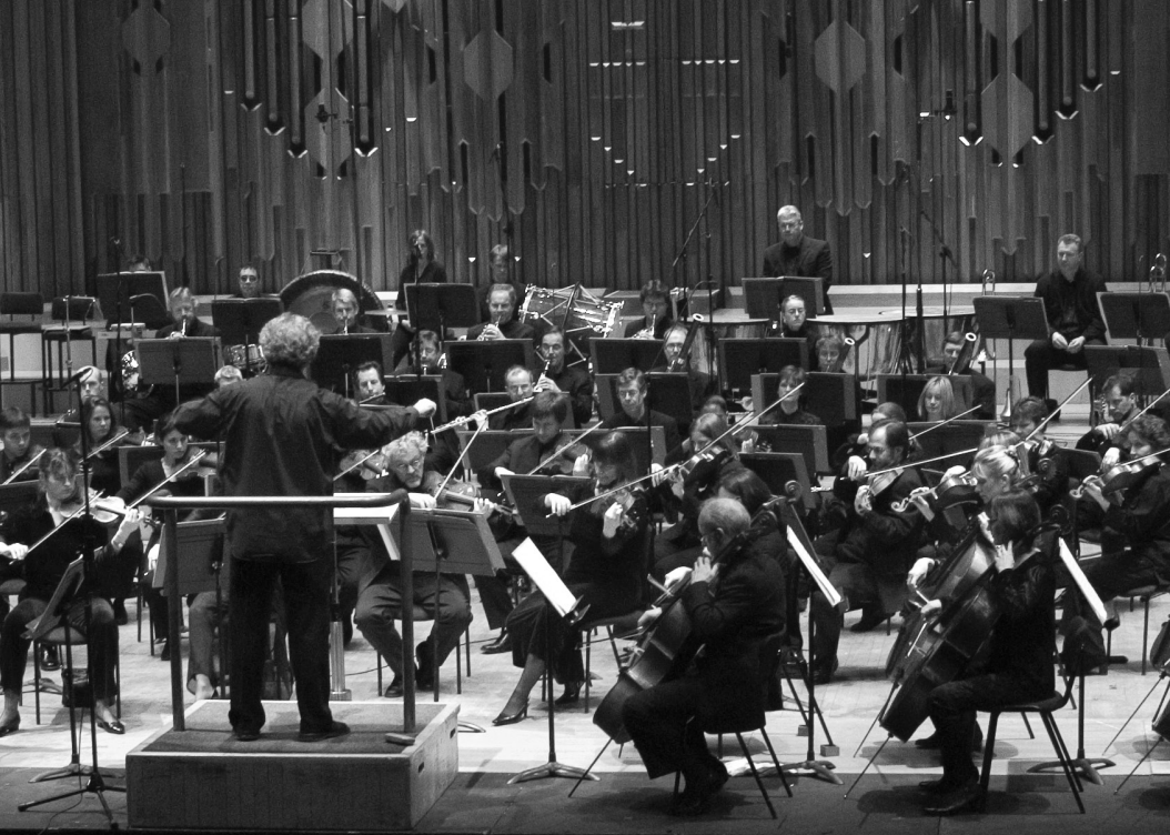
its former Chief Conductor, Jiří Bělohlávek,