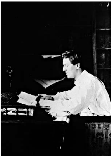
Alban Berg, c. 1925