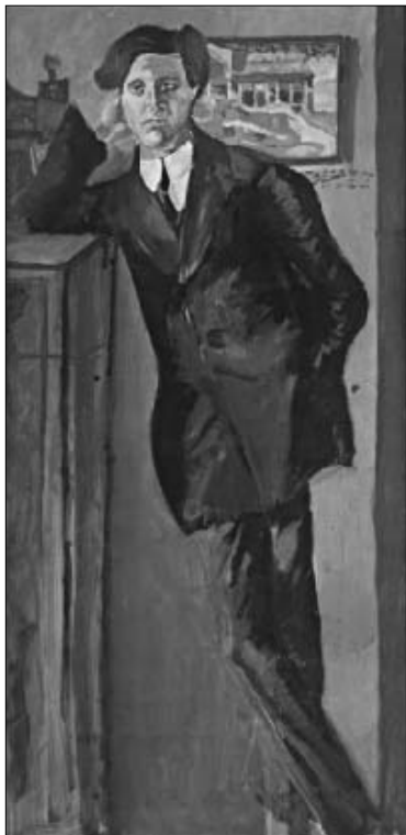
Portrait of Berg painted by Arnold Schoenberg, c. 1910