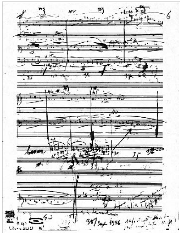
Sketches for the final bars of Berg's 'Lyric Suite', dated 30 September 1926