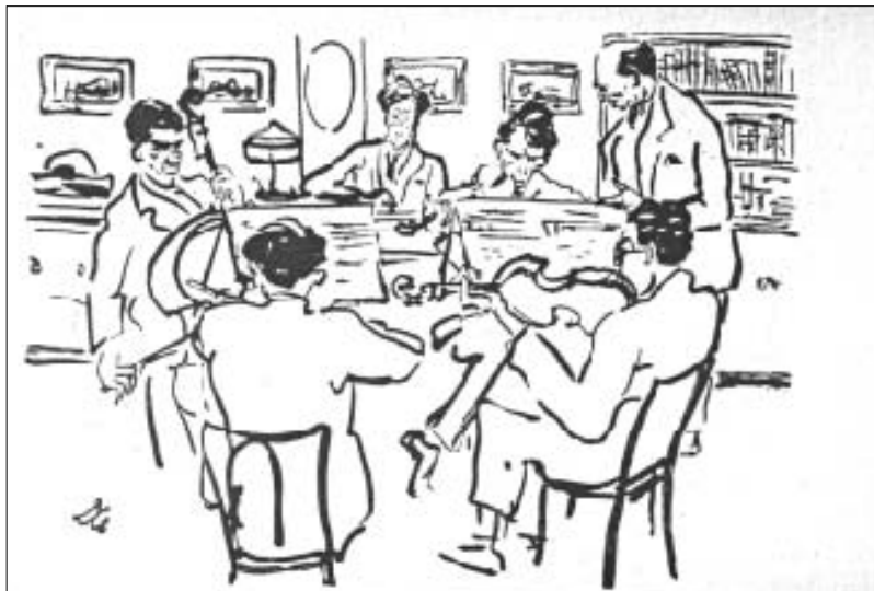
Berg and Schoenberg at a rehearsal of the Kolisch Quartet, 1923