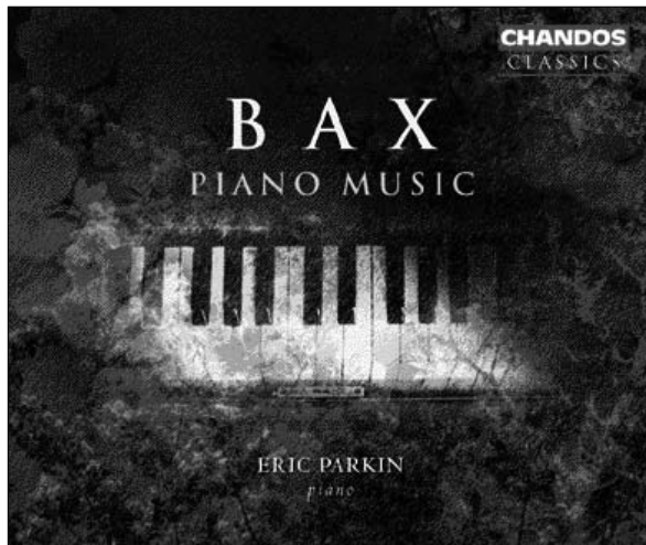
Bax Piano Music CHAN X10132(4)