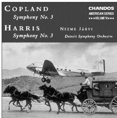
Copland Symphony No. 3 Harris Symphony No. 3 CHAN 9474