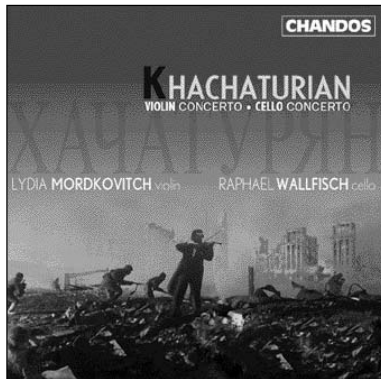
Khachaturian Violin Concerto Cello Concerto CHAN 9866