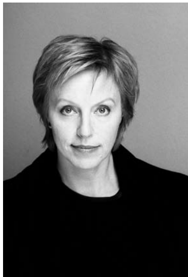
Anne Sofie von Otter