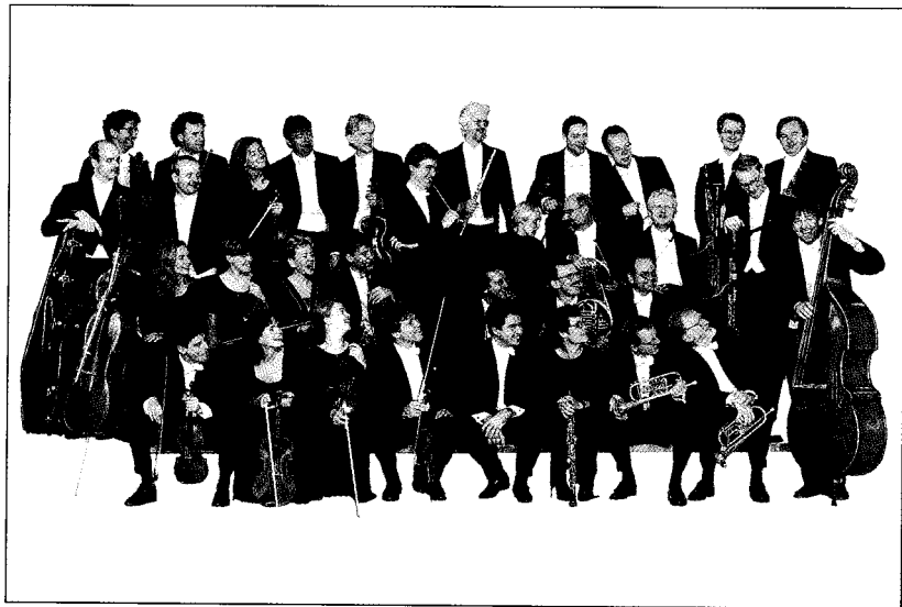
Swedish Chamber Orchestra