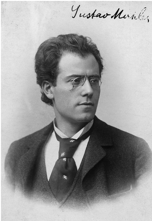
GUSTAV MAHLER (1893)