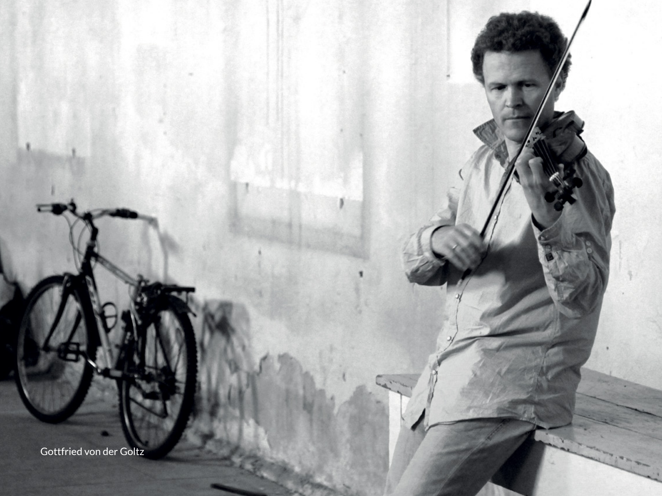
Gottfried von der Goltz