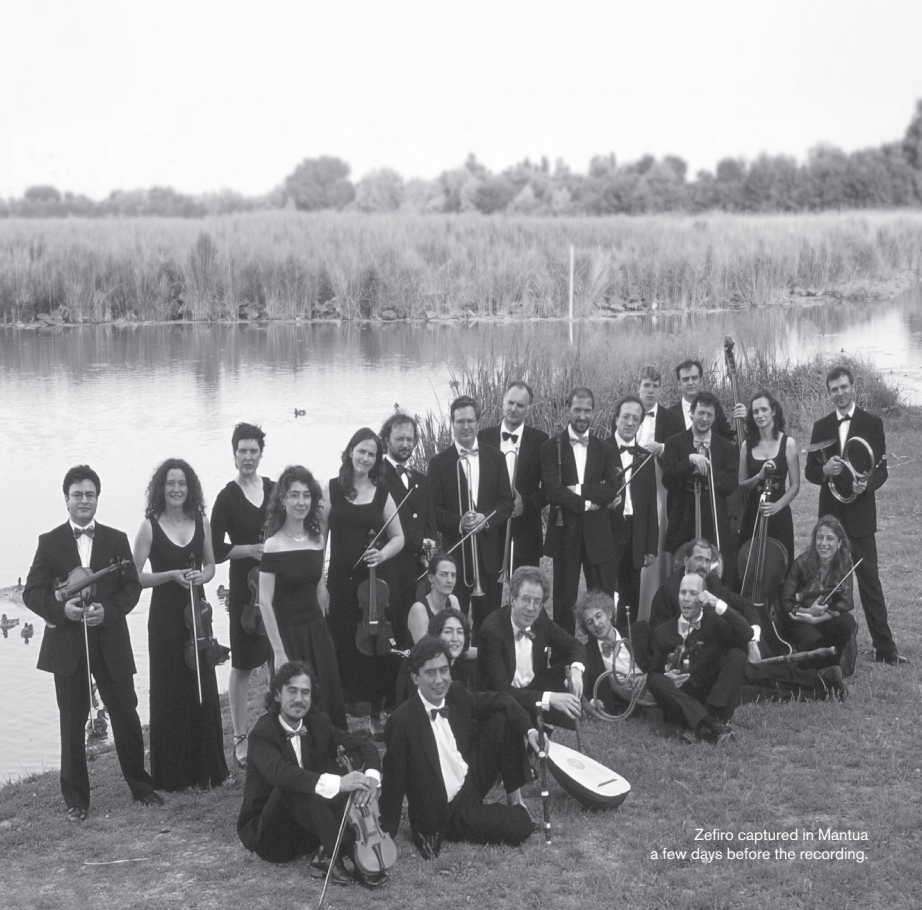
Zefiro captured in Mantua a few days before the recording.